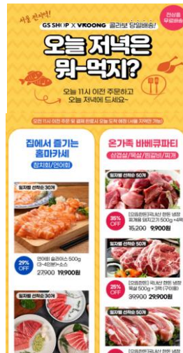
신선식품 당일배송 기획전