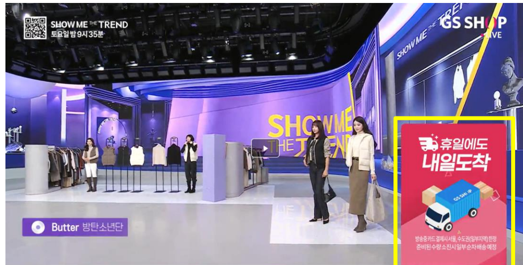
[구스베스트] 24년 8월 제조

(라이브 방송상품 대상) 토요일 주문 상품을 일요일에 받아 보실 수 있는 '휴일에도 내일도착' 서비스로 고객에게 더 나은 배송 경험을 제공 함